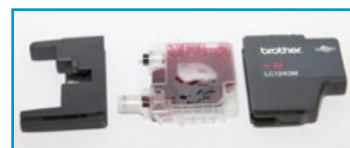
Patrone in Einzelteilen